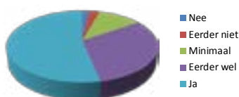
Ik voel me goed op deze school