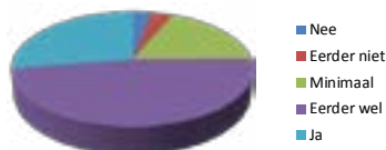
Er is een aangename sfeer op school