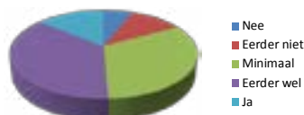
Er wordt aangenaam met elkaar omgegaan