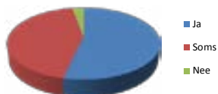
Er zijn duidelijke afspraken en regels